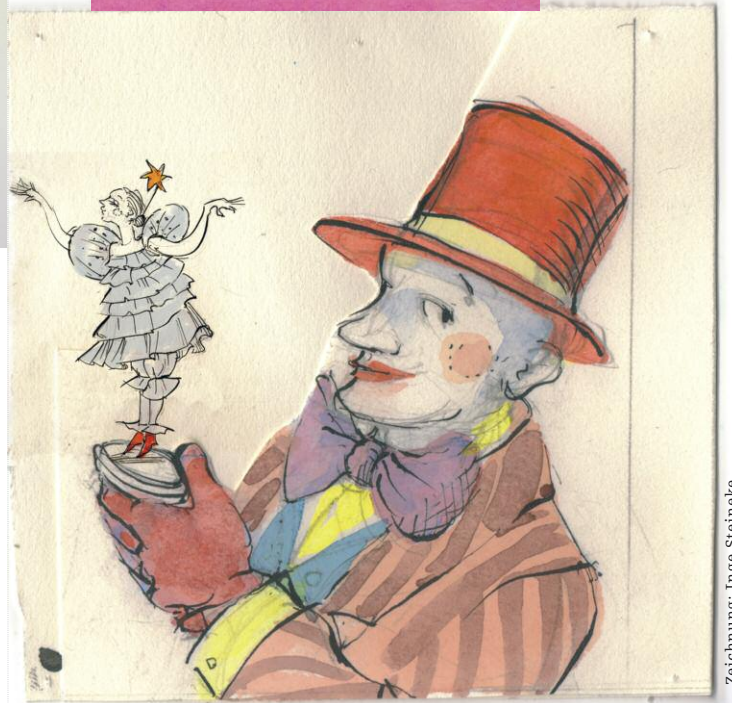
Zeichnung: Inge Steineke